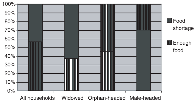
Figure 2 Insécurité alimentaire en Namibie (enquête de 2002)

En Namibie, on a constaté que les ménages touchés par le VIH/sida étaient moins en mesure d'assurer leur sécurité alimentaire en cas de sécheresse. Alors qu'une enquête réalisée en 2002 a montré que 43% de tous les ménages étaient en situation d'insécurité alimentaire durant le dernier mois, l'examen par catégorie indique que les ménages dirigés par des veuves ou des orphelins sont beaucoup plus touchés que ceux qui sont dirigés par des hommes (voir figure 2).