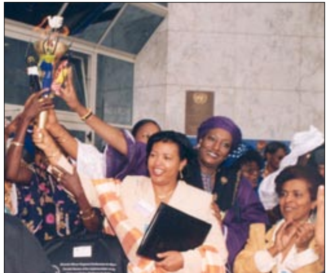
Des participantes allumant la Torche de la paix

16. La voix des femmes dans la prévention des conflits et le rétablissement de la paix est le plus souvent à peine