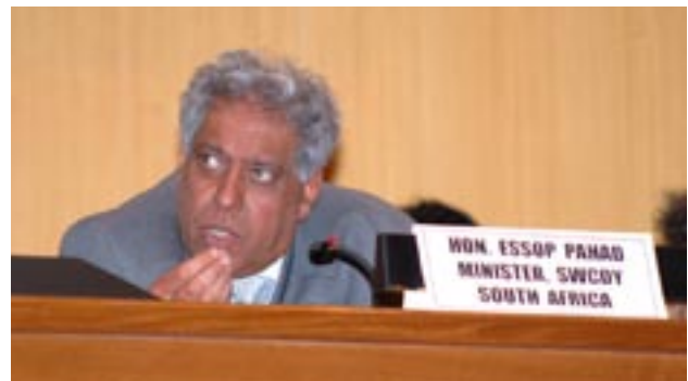
M. E. Pahad, Ministre auprès de la Présidence, chargé du Bureau du statut de la femme, de l'enfant, des handicapés et de la jeunesse

25. Il est impératif que des mesures urgentes soient prises pour améliorer la capacité d'analyse sexospécifique des macroéconomistes à tous les niveaux et dans toutes les institutions, de façon à redéfinir les concepts, les approches et les méthodes qui sont à la base de la production