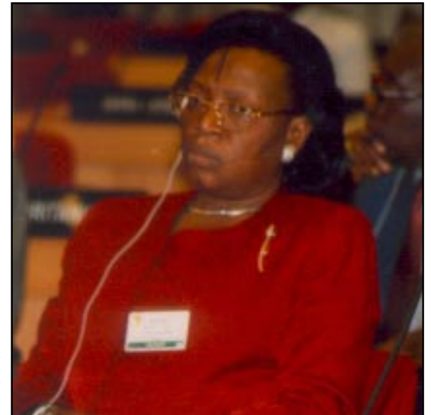
Mme Paulette Missambo, Ministre d'État des transports et de l'aviation civile de la République gabonaise

FDA Info: Au moment où l'on parle d'intégration, la seule compagnie panafricaine existante dans le transport aérien vient de déposer le bilan. Peut-on espérer la naissance d'un autre outil de ce genre au niveau