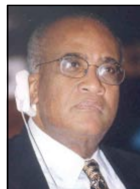
Salim Ahmed Salim, ancien Secrétaire général de l'Organisation de l'unité africaine (OUA)

Les différents initiatives et mécanismes de paix, de sécurité et de règlement des conflits en Afrique ont été inefficaces, a