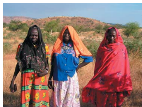
Jeunes filles au Soudan

Aujourd'hui un nombre restreint de femmes ont accès aux médicaments antiviraux et combien d'autres meurent faute d'attention et