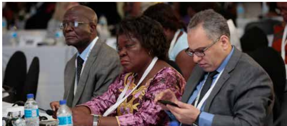
Aaron Ufumelli ECA-Photo

« Le succès est possible, mais seulement si nous nous montrons plus ambitieux, sommes plus mobilisés et avons plus de solutions », dit-elle.