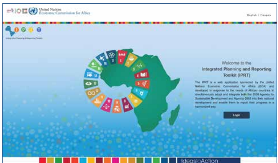
IPRT Platform Screenshot

The Integrated Planning and Reporting Tool - IPRT - Is ECA's response to this challenge. With the use of the Toolkit, users will now be able to assess the lev-