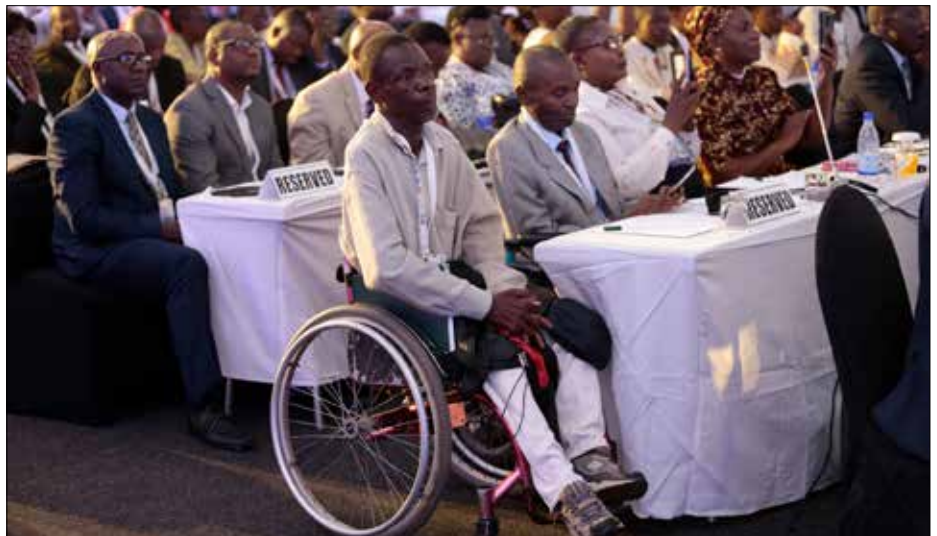
Participants at ARFSD 2020

“Without peace security and stability, prosperity in Africa will continue to remain elusive. Without peace and security, the commitment to leave no one