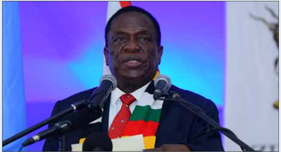
Zimbabwe President Emmerson Mnangangwa

“No one will be left behind as we strive to achieve the Zimbabwe and the Africa, we all want,” he said. He also expressed his hope that the Zimbabwe chapter of the AWLN would provide pathways to improve the quality of lives of women in line with the 2030 Agenda. Prior to the launch, Amina Mohammed, UN Deputy Secretary-General met with the core AWLN team and said the national chapters are important in deepening the roots of women leadership, as meaningful