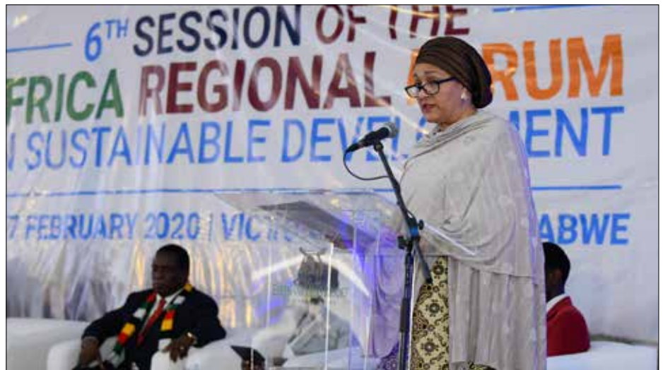
Ms. Amina Mohammed, UN Deputy Secretary-General

She said the nexus between climate change, hunger, terrorism, conflict and displacement was causing havoc and human suffering in many countries, not least in the Sahel and the Horn. In addition, stressed Ms. Mohammed, gender inequality was costing sub-Sa-